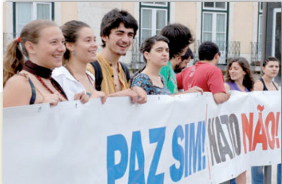
Junto à Assembleia da República, activistas da campanha mostraram ao Secretário-geral da NATO que não era bem-vindo no nosso país

guês que, «participando nas negociações ao nível da NATO, esconde ao povo português as posições que tem defendido e não promove um amplo, sério e plural debate nacional quanto às gravosas consequências de atrelar Portugal a esta nova escalada militarista e de guerra, aliás, em flagrante contradição com o consagrado na Constituição da República Portuguesa».