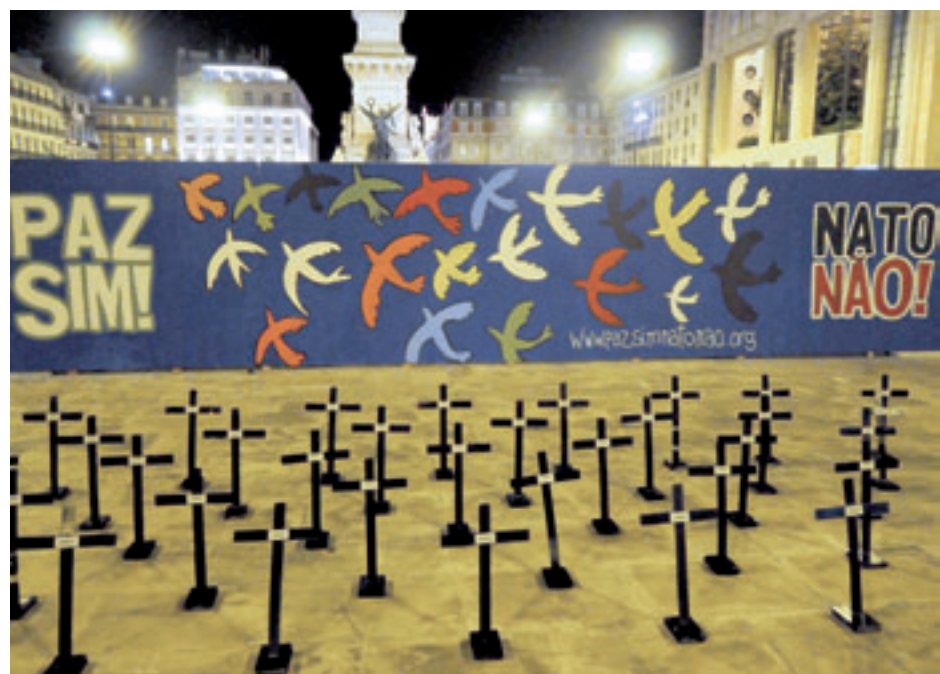
A pintura de um mural nos Restauradores, em Lisboa, assinalou o repúdio pela estratégia agressiva da NATO e afirmou a vontade de construir um mundo de paz. Retirado do local pela autarquia, o mural foi recolocado junto ao Campo Pequeno. Num dos lados, dá-se relevo à campanha, enquanto no verso se apela à participação na manifestação de 20 de Novembro, em Lisboa.

aliança atlântica e os sinistros objectivos que presidem à cimeira de Novembro. No final, todos ficaram mais despertados para a necessidade de combater a NATO e de continuar a pugnar por um mundo de igualdade, justiça e paz.