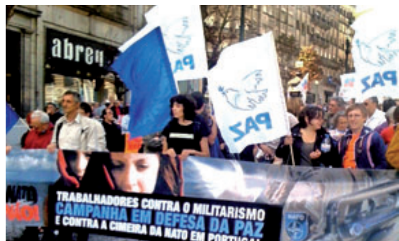
A campanha esteve nas comemorações do 25 de Abril e do 1.º de Maio